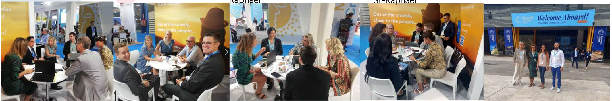
Rappresentanti del Club Crociere Regione Sud