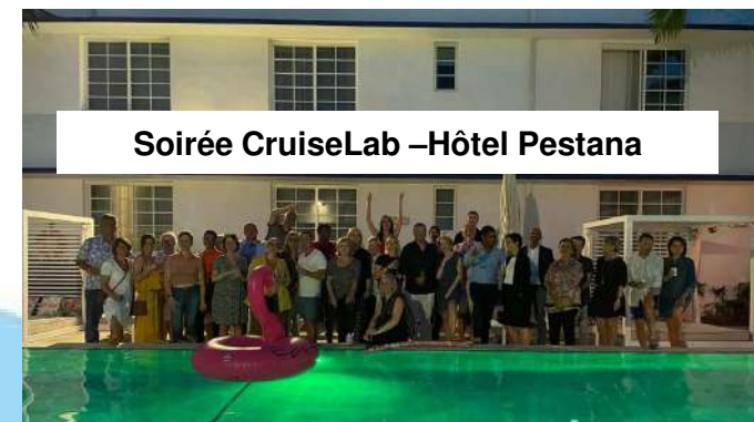
Soirée CruiseLab –Hôtel Pestana

Invitations transmises à l'ensemble du fichier clients armateurs et presse, près de 200 personnes présentes le jour d'ouverture du salon - Très bonne fréquentation du stand. Opération de communication réussie !