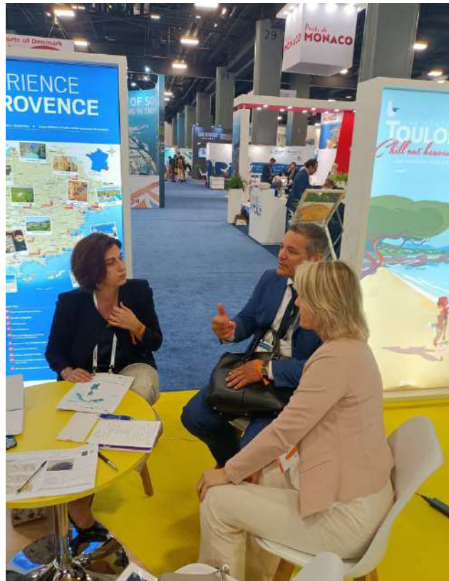
Explora journeys- segment luxe