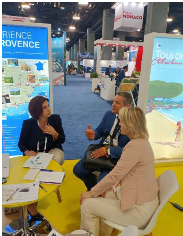
Explora journeys- segmento lusso