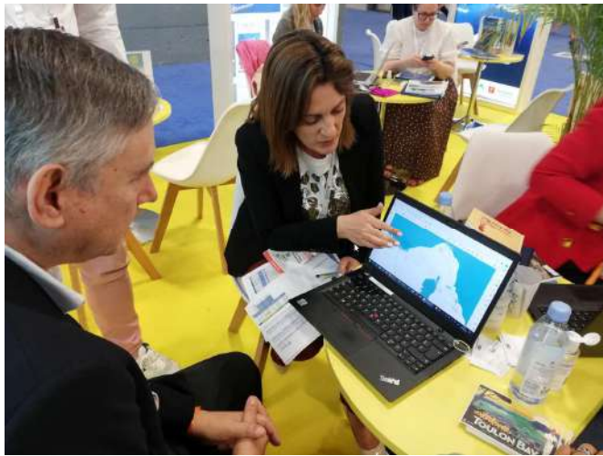
Azamara Cruises – segmento del lusso

Presenza delle due CCI : Var e Corsica su uno spazio di 9 m 2 ciascuna. 32 incontri con gli armatori con presentazione della brochure RITINERA Excursions Zero Emission carbone, per tutti li itinerari e escursioni.