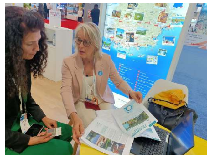
Princess Cruises– segment premium