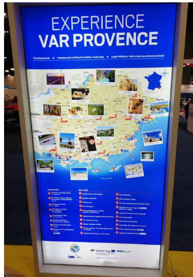
Cartello illuminato per lo stand Var Provence con il logo Interreg RITINERA e le escursioni var RITinERA