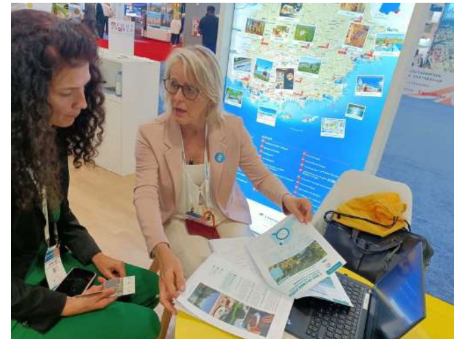
Princess Cruises– segmento premium