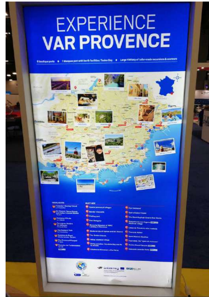
Enseigne lumineuse du stand Var Provence sur laquelle figure le logo Interreg RITINERA et les excursions varoises RItinERA