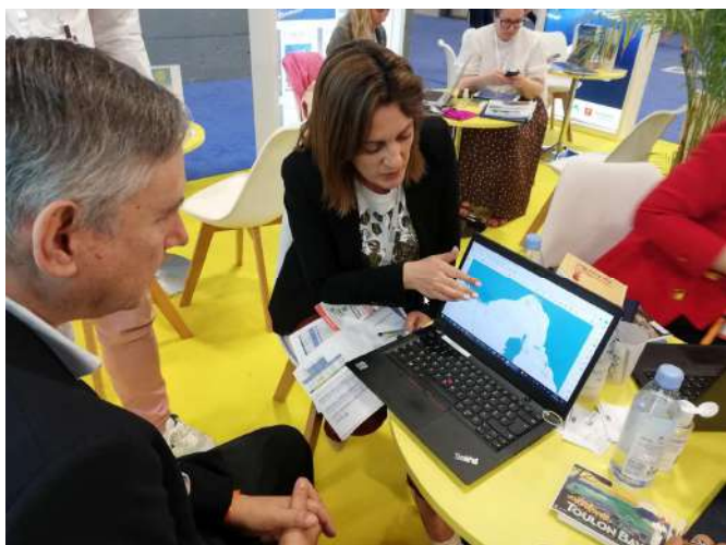
Azamara Cruises – segment luxe

Présence des deux CCI : Var et Corse sur un espace de 9 m 2 chacun. 32 rendez-vous avec les armateurs avec présentation de la brochure RITINERA Excursions Zéro Emission carbone, pour l'ensemble des itinéraires et excursions.